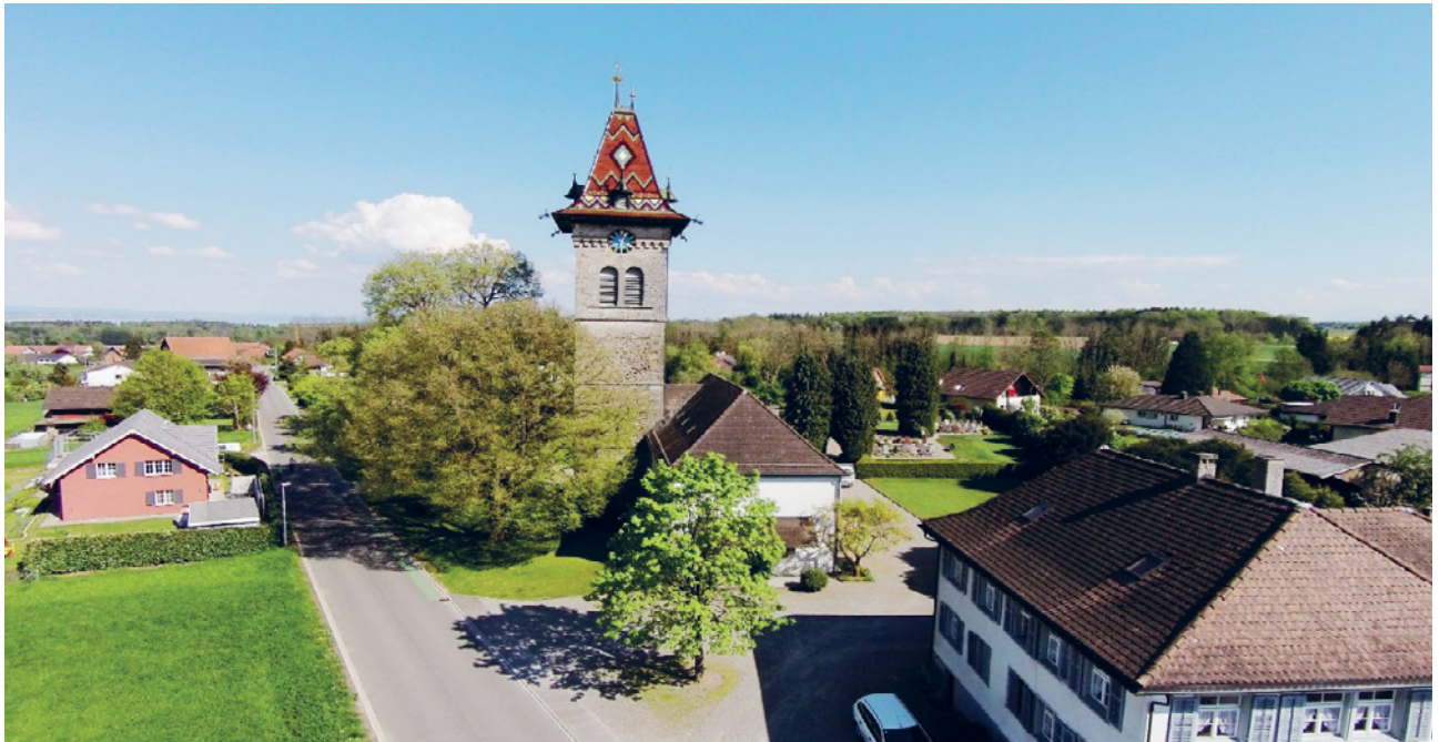
Kirche Oberhofen